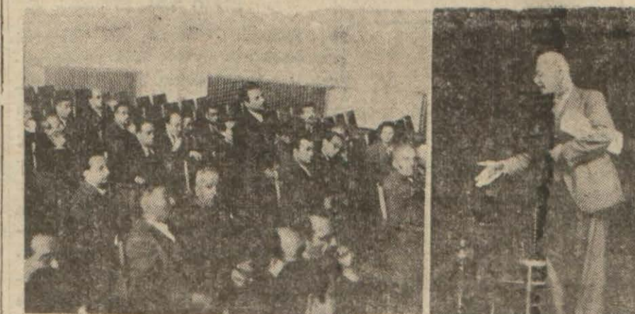
Toplantıdan iki intiba

Basın Birliği mensubları, dün saat 14 de Eminönü Halkevinde bir toplantı yapmışlardır. Bu toplantıda günün ihtiyaçları, basın mensublarını alâkadar eden